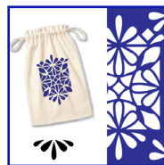
Création de motifs azulejos